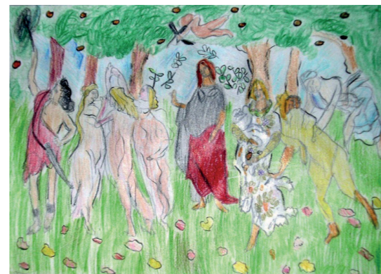
Classe III, scuola primaria "Masih", Certaldo (FI). La Primavera di Botticelli.

Due incontri per avvicinarsi alla famiglia Medici e fare una personale scoperta del museo con avvio alla lettura dell'opera d'arte. Il secondo incontro si svolge esclusivamente di lunedì mattina a museo chiuso.