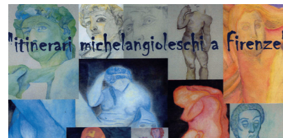
Classe III B, scuola secondaria di I grado "E. Balducci", Fiesole

Si consiglia la visita al museo della Casa Buonarroti (per informazioni e prenotazioni tel. 055 241752)